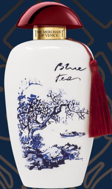
BLUE TEA TESTER EDP 100 ML