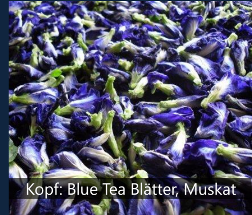
Kopf: Blue Tea Blätter, Muskat