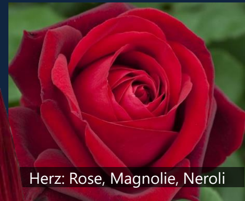
Herz: Rose, Magnolie, Neroli