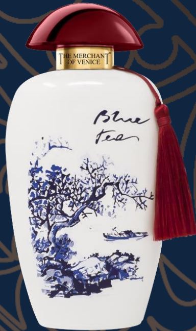
BLUE TEA EDP 100 ML