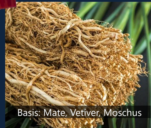
Basis: Mate, Vetiver, Moschus